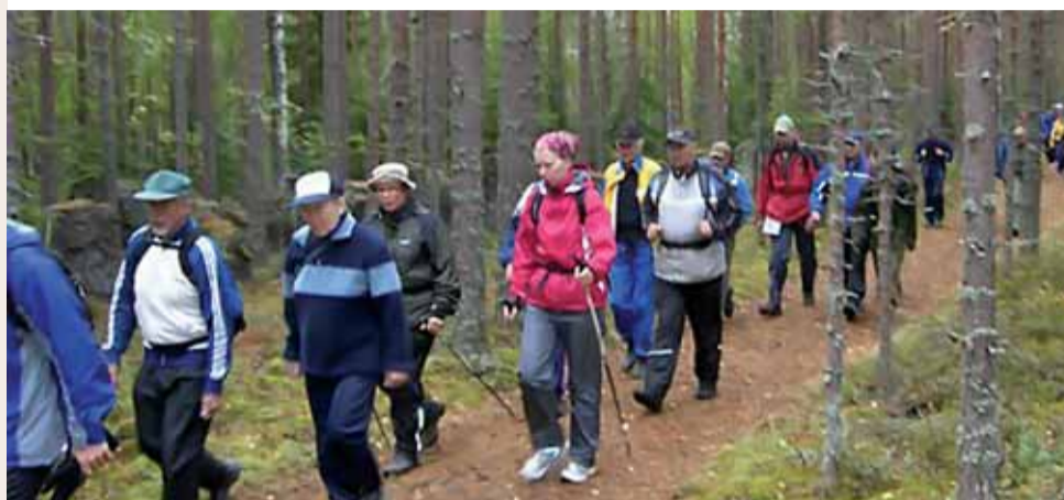
Vaeltajia Virolahden salpapolulla

Salpapolku etenee Suomen puolustuslinjaa eli Salpalinjaa mukaillen. Retkeilyreitti alkaa Virolahden merellisistä maisemista ja etenee sieltä Harjun Oppimiskeskuksen kartanomiljöoseen. Sieltä lähdetään Virolahden Bunkkerimuseolle, johon voi kesäaikana tutustua oppaan johdolla. Museoita reitti etenee perinteisessä kaakkoissuomalaisissa maaseutumaisemassa Miehkikälään, josta jatketaan Vuolteen tietä Jermulan veteraanikämpälle. Jermulasta jatkeaan Salpalinjoen kautta Askolaan. Reitin varrella mm. 16 taukopaikkaa ja kolme varausaunaa. Lisätietoja saa Salpapolun retkeilykartasta, Virolahden, Miehkikälän, Ylämaan ja Luumäen kuntien internetsivuilta, vapaa-aikatoimistoista sekä Salpakeskuksen sivuilta: www.salpakeskus.fi.