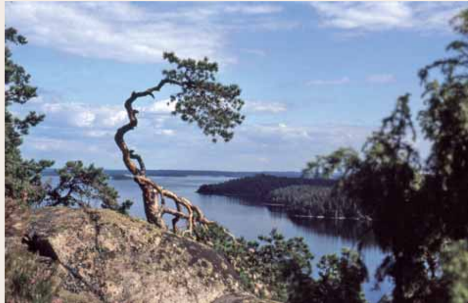
Näkymä Iitin Hiidenvuorelta Jaalan Pyhäjärvelle

ETELÄ-KYMENLAAKSOSSA luontomatkailejaa kiehtoo meri ja Itäisen Suomenlahden saaristo. Ulkoasaristossa sijaitsee Itäisen Suomenlahden kansallispuisto. Kaakonkulman ja Etelä-Karjalan nähtävyyksiin kuuluu Virolahden Majaniemestä alkava ja Sallaan päättyvä Salpalinja.