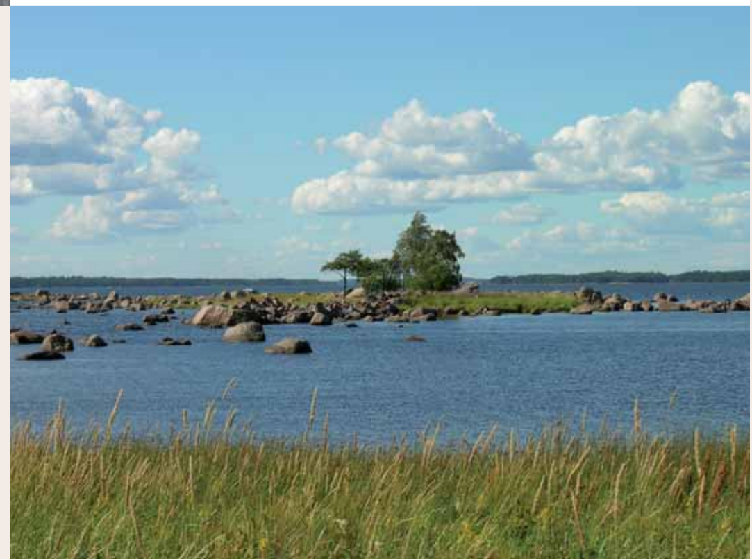
Näkymä melontareitiltä Haminasta

Maamme merkittävimpiin kuuluva, esihistoriallinen Verlan kalliomaalaus on lähes 6000 vuotta vanha. Kymenlaakson 27 ja Etelä-Karjalan 18 kalliomaalausta kertovat Suomen muinaisesta asuttamisesta, elinkeinoista, uskonnollisista ja traditioista. Välväylän melontareitti on aikamatkailua parhaimmillaan - sen varrella pääset katsomaan 11:tä kalliomaalausta