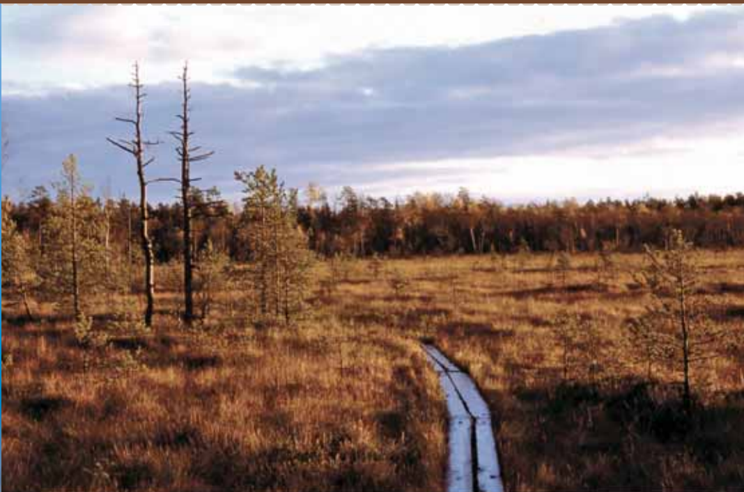
Valkuman kansallispuisto, Pyhtää