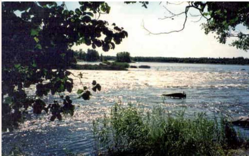
Abvion koski Anjalankoskella

Suunniteilla oleva "Maaherran kierros" (Iitti/Vuolenkoski-Kimola-Jaala-Heinola-Vuolenkoski) n.110 km muodostuu kahdesta eri reitikkokonaisuudesta. Lyhyt maaherra on noin 38 km mittainen ja muodostuu Iivesreitistä ja Vuolenkoski-Heinolan Juustopolusta. Tätä pidempi reitikkokonaisuus jatkuu Vuolenkoskelta Kimolaan ja edelleen Jaalaan ja Harjukannasten kautta Heinolaan. Lisätietoja Heinolan, Iitin ja Jaalan vapaa-aikatoimistoista.